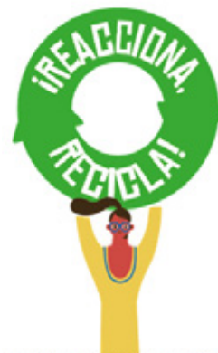
CONCURSO ¡REACCIONA, RECICLA! CAMPAÑA DE SENSIBILIZACIÓN SOBRE EL RECICLAJE.

1. Diagnóstico: Qué residuo o residuos eligen para su campaña y por qué razón. 2. Público destinatario: A quién nos dirigimos si queremos mejorar el reciclaje del residuo elegido. 3. Objetivo: Definir bien qué queremos conseguir y en qué plazos. 4. Medios y estrategias: Elegir un lema o eslogan que transmita el mensaje que queremos difundir. Definir los recursos que vamos a utilizar para difundir el mensaje. Por ejemplo: carteles, gráficos audiovisuales, folletos, presentaciones, cortos, charlas o conferencias, entre otros. 5. Plan de acción: Planificar las acciones necesarias para difundir los mensajes. Por ejemplo: difusión en redes sociales, charlas en las clases, exposiciones, flashmob, eventos culturales, cine, conferencias, encuestas, etc. Establecer un calendario de acciones y responsables. Puesta en marcha de la campaña. 6. Evaluación: Medir los resultados obtenidos y valorar si se han conseguido los objetivos de partida. Los participantes deberán enviar una memoria o relato digital ( resumen, imágenes y/o vídeos ) del proceso en